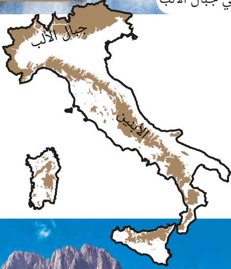
مونت بلانك في جبال الألب