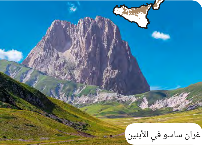
گران ساسو في الأبينين