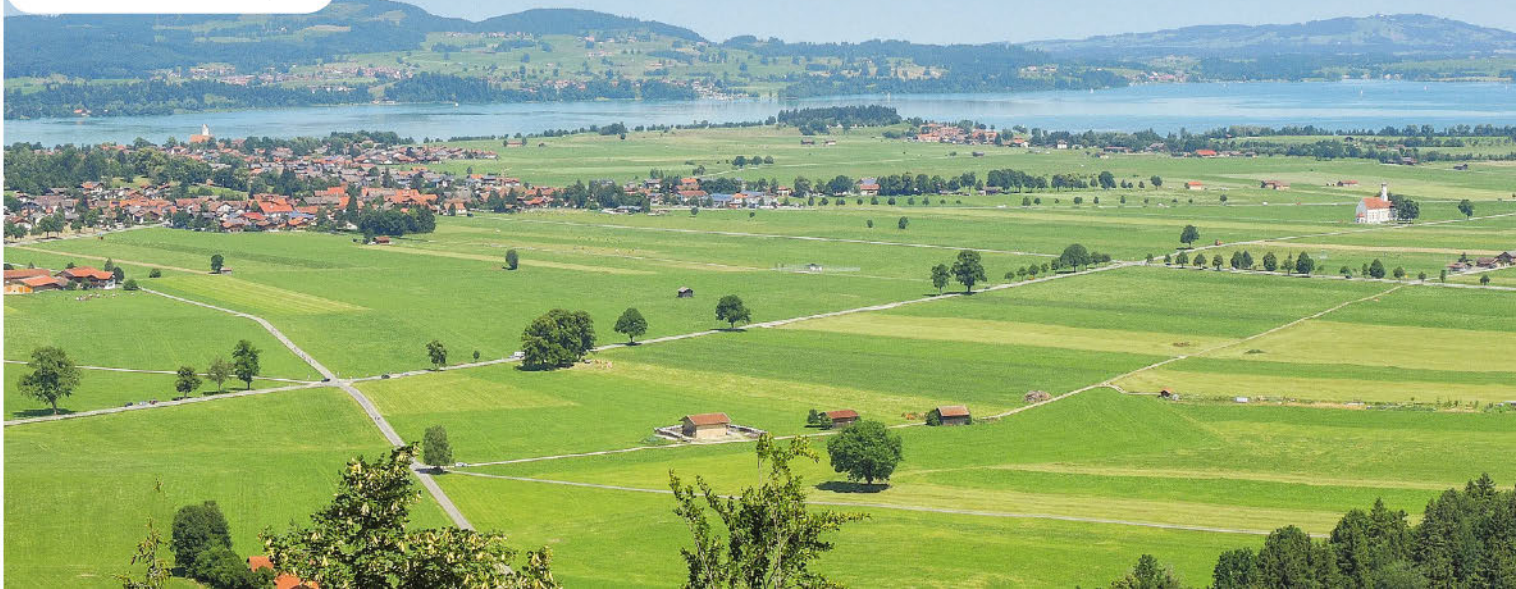
Plaines en Allemagne