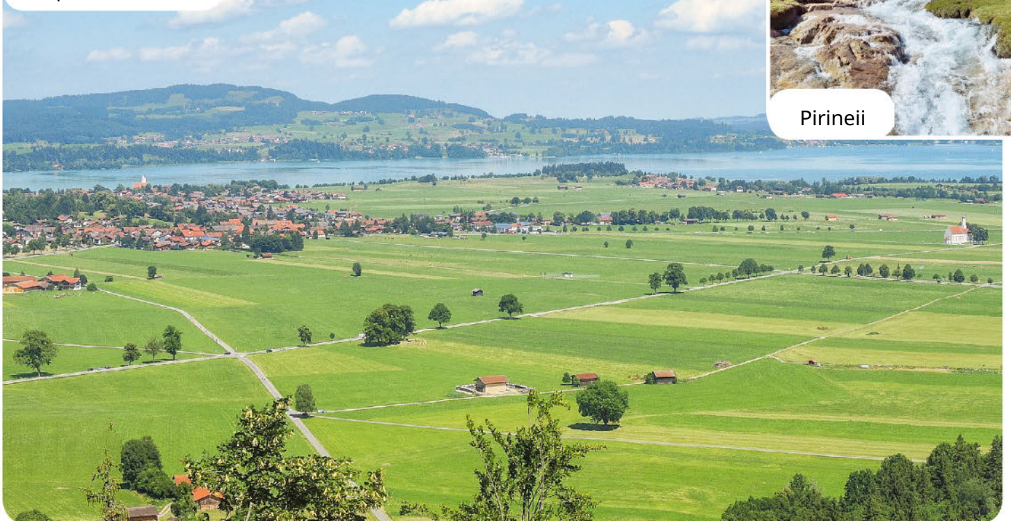
Câmpie în Germania